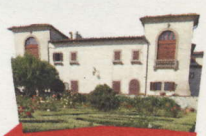
Villa del Palco